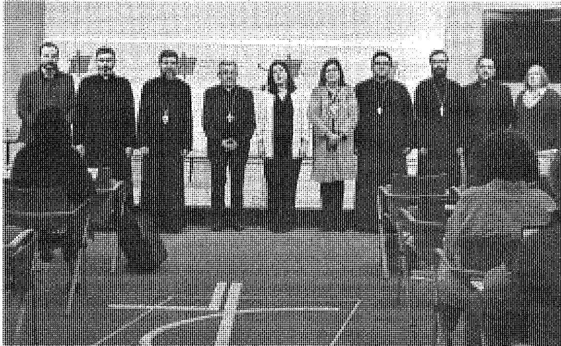
El presidente de la Conferencia Episcopal, Luis Argüello, con representantes de las iglesias ortodoxas y evangélicas, ayer.

La Conferencia Episcopal Española (CEE), junto a las iglesias evangélicas y ortodoxas en España se unieron ayer para pedir "respeto, justicia y compasión" para las personas migrantes y que se promuevan leyes justas y políticas de integración real, "sin criminalización ni exclusión". Lo hicieron en el informe sobre la atención que cada una de las confesiones cristianas con presencia en nuestro país están realizando en materia de acogida, integración y promoción de las personas migrantes, que ha elaborado la Mesa de Diálogo Interconfesional de España y se ha presentado este jueves.